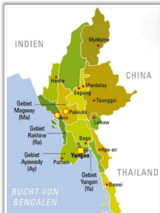
Unsere Arbeitsgebiete: Yangon, Ann (Staat Rakhine) und Pakokku (Region Magway)

Die Schwierigkeit für unser Team ist, dass wir die Menschen in den Projektgebieten seit Ende 2019 nicht besuchen und die Projektleitenden nicht ausbilden und ermutigen können. Wie es nach dem Militärputsch vom 1. Februar 2021 weitergeht, bleibt offen.