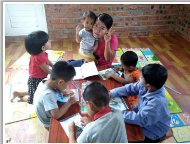
Kindergarten von Huai Huai in Yangon

Im Jahr 2020 hatten wir in unserem vielfältigen Portfolio insgesamt 99 Projekte, wovon 13 erfolgreich abgeschlossen und 11 neu bewilligt wurden.