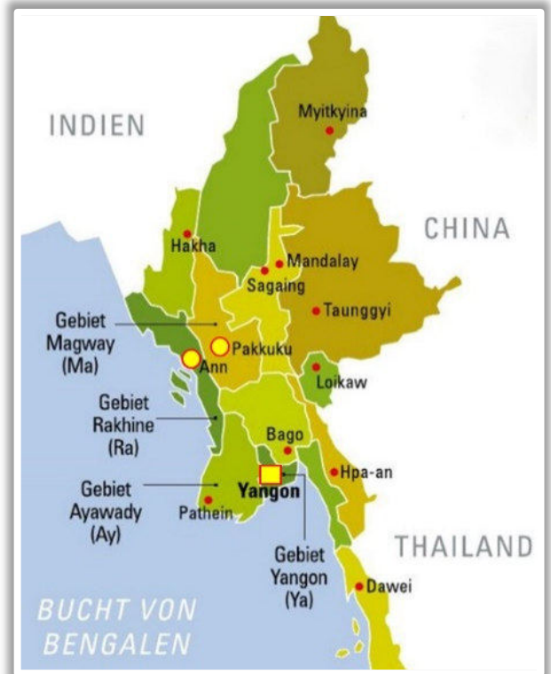
Unsere Arbeitsgebiete: Yangon, Ann (Rakhine) und Pakokku (Magway)