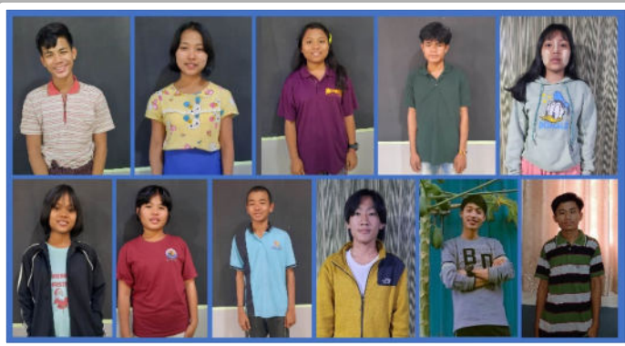
Unterstützung von Schülerinnen und Schülern

Im Jahr 2024 werden wir auch Studierende und Jugendliche in der Berufsausbildung unterstützen .