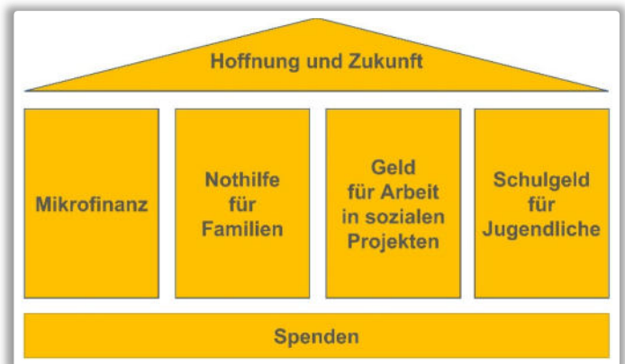
Die vier Säulen unserer Unterstützung

Wir sind beeindruckt von der grossen Dankbarkeit, der Fröhlichkeit und dem Gottvertrauen der Menschen trotz ihrer schwierigen Situation.