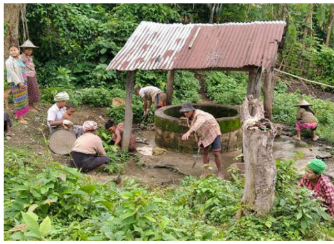
Reinigung eines Brunnens im Staat Rakhine

Jeden Monat konnten 14 Familien, die unter dem Existenzminimum leben müssen, eine finanzielle Nothilfe für Nahrungsmittel erhalten.