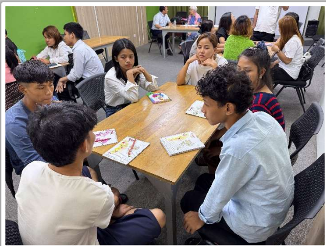
Workshop mit Programmteilnehmenden im November

Wir freuen uns über die in so kurzer Zeit erzielten Fortschritte und den Willen der Teilnehmenden, zu lernen und finanziell unabhängig zu werden. Von den insgesamt 44 Teilnehmenden sind 13 zertifiziert und verdienen Geld, 21 sind noch in der Ausbildung, 4 haben ihre Ausbildung noch nicht begonnen und 6 sind auf Arbeitssuche.